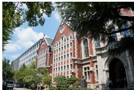
レトロな建物が多く歴史を感じました。 図書館旧館前。創設者：福沢諭吉の銅像。